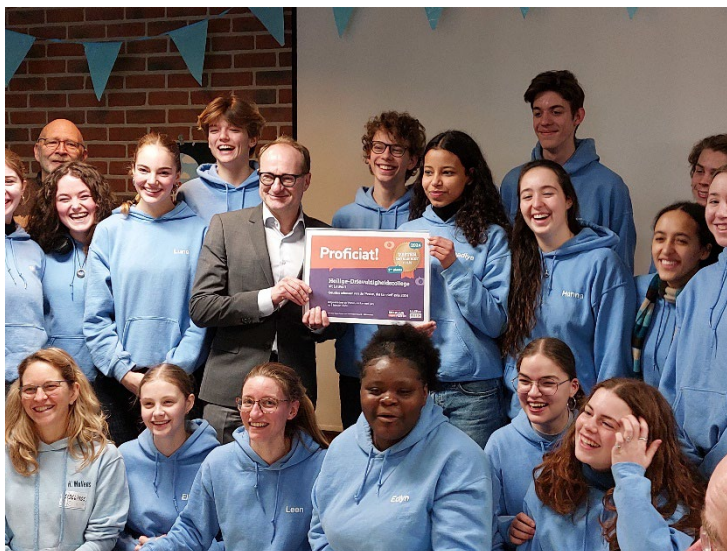
Minister Ben Weyts deelt de prijs uit!